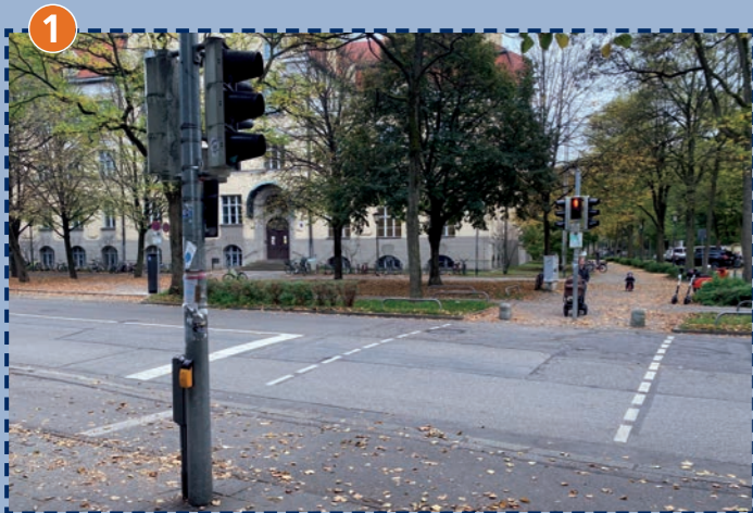
Dom-Pedro-Platz, Übergang vor der Schule